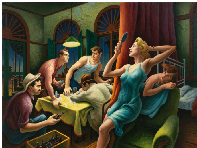
Thomas Hart Benton (1889-1975) "Poker Night". From A Street Car Named Desire, 1948, Whitney Museum of American Art, New York City.

"Quando ci fu luce a sufficienza per usare il binocolo ispezionò la valle sottostante. Tutto sfumava nell'oscurità. La cenere si sollevava leggera in lenti mulinelli sopra l'asfalto. Studiò quel poco che riusciva a vedere". (McCarthy, "La strada").