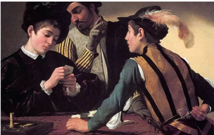
Caravaggio (1571-1610) "I bari". 1594, Kimbell Art Museum, Forth Worth.

L'ultima carta del poker è quella della Banca del Giappone, unica banca delle economie avanzate che in splendida solitudine mantiene i tassi sotto lo zero.