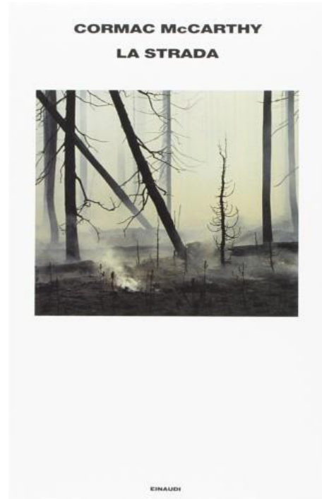
C. McCarthy (1933-2023) "La strada" (Einaudi, 2007)

Come i due sopravvissuti del romanzo, la Federal Reserve si è messa in difesa, ha preso tempo, aspetta di vedere i nuovi dati economici e quali saranno gli effetti di medio termine della crisi delle banche regionali. Una strada già percorsa, e abbandonata, dalle banche centrali di Canada e Australia, tornate ad aumentare i tassi dopo una pausa.