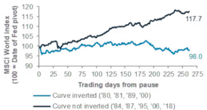
S&P500 performance after a Fed pause

Nelle condizioni di curva invertita la storia mostra che le pause della Fed non sono state di aiuto al mercato azionario.