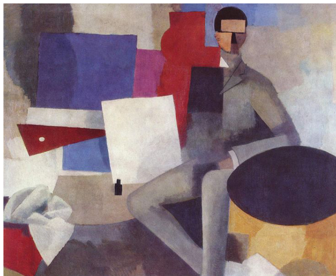
Roger-Noël-François de La Fresnaye (1885-1925), Ritratto (1914,)

Tornando ai mercati, sono passati nella modalità di parziale riduzione del rischio dopo il lungo rally iniziato nell'ottobre 2022 e terminato nell'estate. L'appuntamento con le trimestrali societarie, avviato in questi giorni, è importante soprattutto per valutare le condizioni del settore tecnologico; le "Big Seven" hanno guidato le performance del listino, i loro risultati costituiranno una ragionevole indicazione sulla sostenibilità, o meno, degli attuali prezzi di borsa.