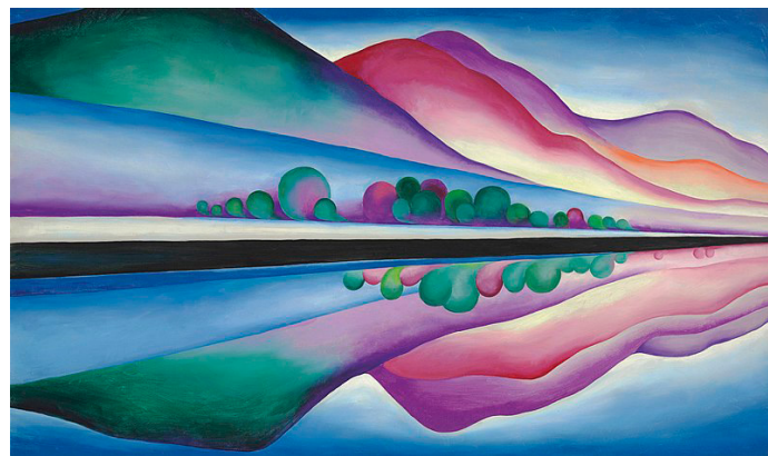
Georgia O'Keefe (1887-1986), "Riflessi del Lago George" (1921,)

C'è stata invece domanda di Treasury, tradizionale porto sicuro nelle fasi di turbolenza, i rendimenti sono scesi dai picchi raggiunti nei giorni precedenti.