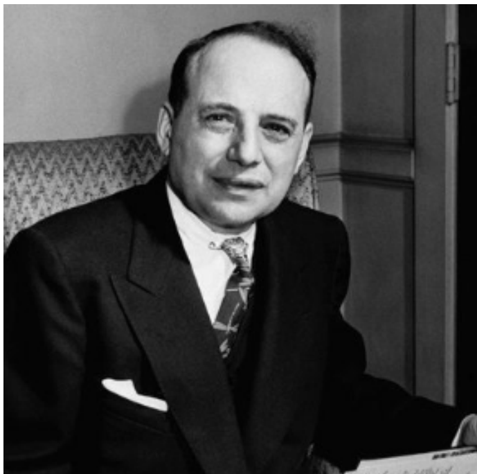
"Investing isn't about beating others at their game, it's about controlling yourself at your own game" Benjamin Graham, The Intelligent Investor

Gli errori dovuti a comportamenti errati, in altre parole gli errori dovuti a decisioni prese sull'emozione o sull'ansia, sono i più costosi. L'antidoto è nell'impegno a restare coerenti al metodo, mantenere la concentrazione sugli obiettivi di lungo periodo, non lasciarsi distrarre dai movimenti dei mercati.