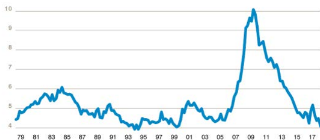
Tasso di insolvenze nel mercato immobiliare USA rispetto ai crediti complessivi.