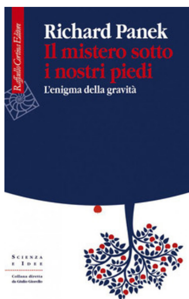
R. Panek “Il mistero sotto i nostri piedi”, Edizioni Raffaello Cortina 2020

In queste settimane è in libreria un bel libro dedicato alla scoperta delle leggi della gravità. L'autore, Richard Panek, accompagna il lettore nella progressiva scoperta del “mistero sotto i nostri piedi”, dalle antiche cosmogonie del Cielo e della Terra, della separatezza tra “lassù” e “quaggiù”, fino alle intuizioni di Galileo, Newton, Einstein.