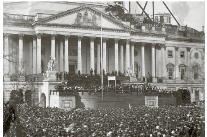
4 marzo 1861, Inauguration Day del presidente Abraham Lincoln, è la prima documentazione fotografica della cerimonia di insediamento.

La Yellen parla al Senato di momento storico favorevole alla spesa perché i tassi sono bassi e il debito potrà essere più facilmente ripagato con tassi di crescita superiori ai tassi del costo del servizio finanziario. E' un aspetto decisivo che interpella anche i governi europei e, significativamente, il governo italiano: investimenti di lungo termine che pongano le premesse per crescita stabile e duratura.