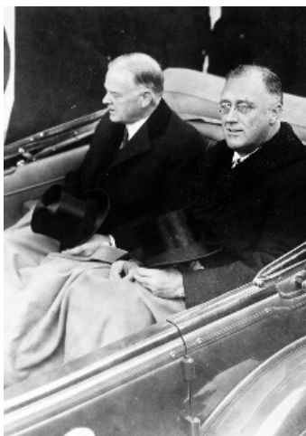
4 marzo 1933, il presidente eletto Franklin Delano Roosevelt e Herbert Hoover si dirigono verso Capitol Hill per la cerimonia del giuramento.

Parole di riconciliazione e speranza che però Trump non ha ascoltato, quarto presidente nella storia americana a non rispettare la consuetudine del passaggio di consegne; la prima volta fu nel 1801, quando John Adams rifiutò di essere al fianco dell'ex amico Thomas Jefferson il giorno del giuramento. I due Padri Fondatori si sarebbero in seguito riconciliati e, per una singolare combinazione, morirono entrambi lo stesso giorno, il 4 luglio 1826.